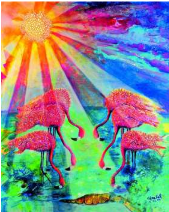
„Gesegnet“ von der Künstlerin Chantal E.Y. Bethel aus den Bahamas

Am 6. März wird der Weltgebetstag der Frauen gefeiert. Das Thema für den Weltge- betstag 2015 lautet: „Ich. Für euch. Versteht ihr? – Jesus“